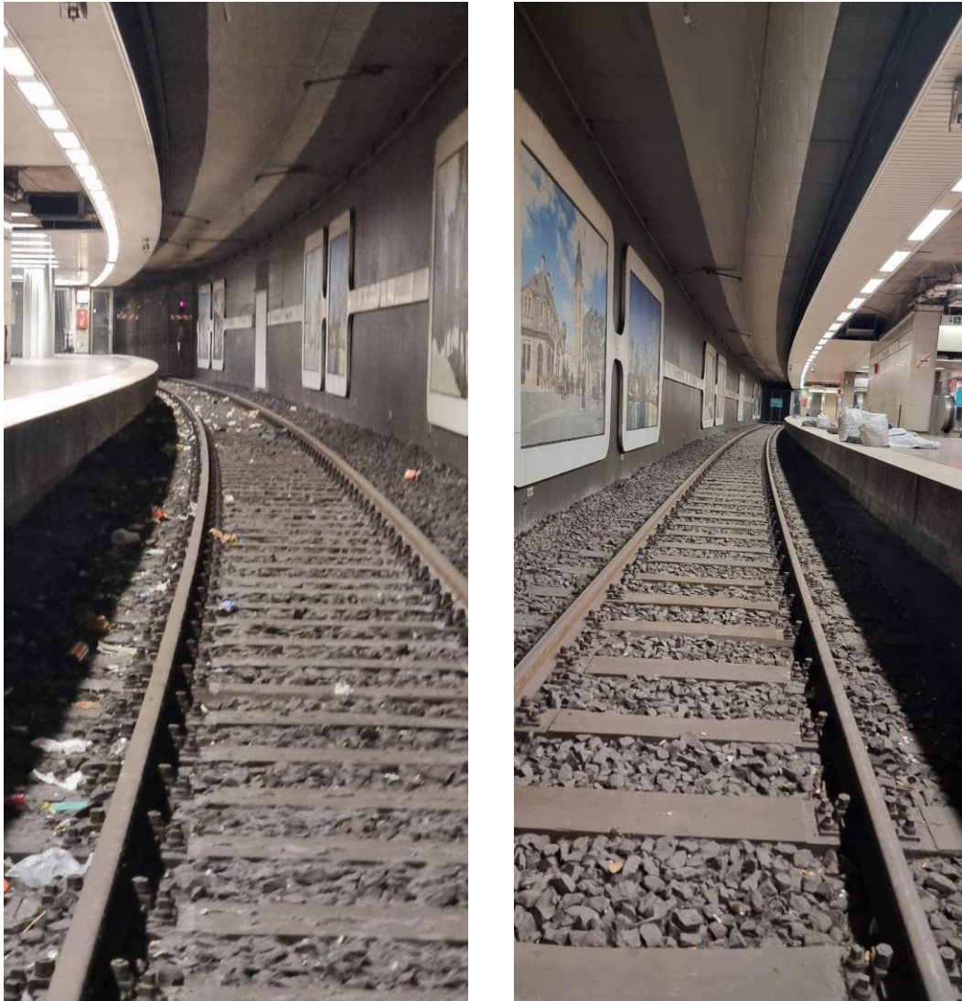
U-Bahngleis in der C-Ebene des Hauptbahnhofes vor und nach der Reinigung durch die Fegerflotte