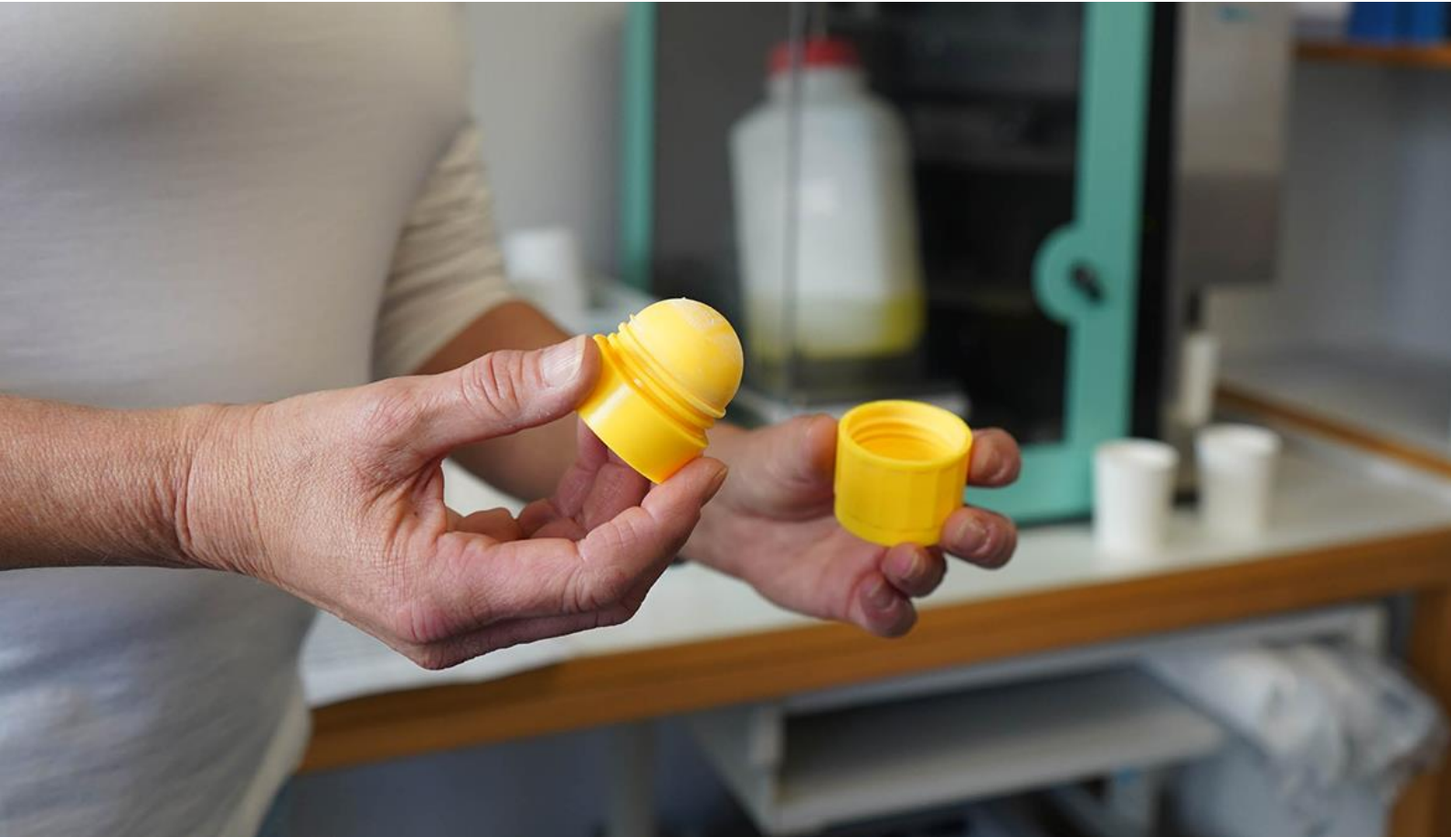
Medizinische Ambulanz: Substitut-Vergabe