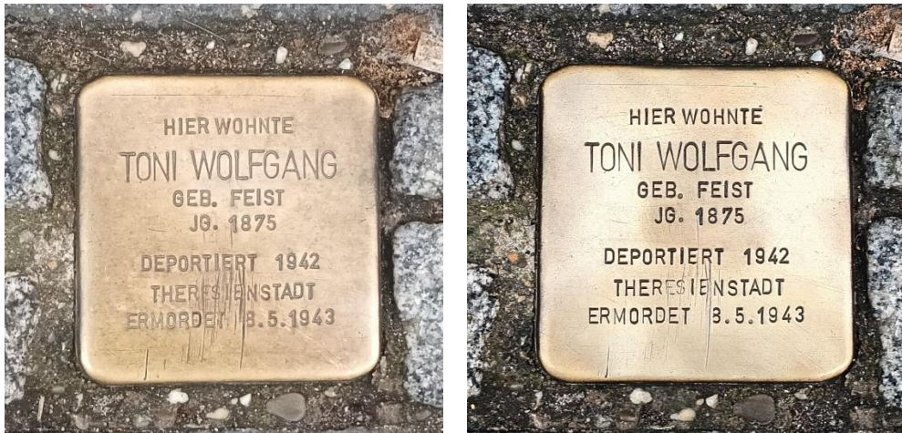
Projekt „Reinigung und Aufbereitung der Stolpersteine im Bahnhofsviertel“